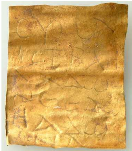
Bild: das Schutzamulett von Halbtum mit dem „Höre Israel“ (Dtn 6,4), Hebräisch mit griechischen Buchstaben

Am 27. und 28. Mai 2010 auf der Edmundsburg, Mönchsberg 2 5020 Salzburg, Europasaal