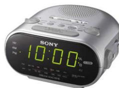
el reloj despertador