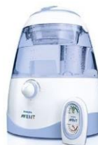
el humidificador del aire