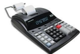
la máquina calculadora