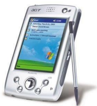
la agenda electrónica