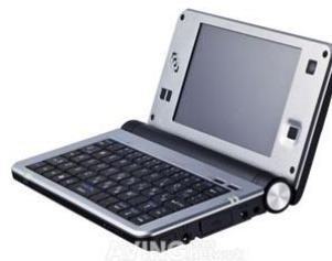
la minicomputadora de bolsillo