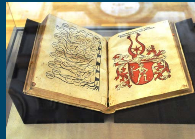
Besonderes Ausstellungsstück unter Glas (Jacobus Publicius: Ars oratoria. Augsburg, Radolt 1490, Signatur W I 223/1).