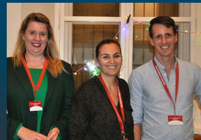
MitarbeiterInnen der Fakultätsbibliothek für Rechtswissenschaften