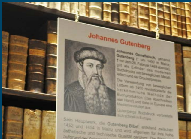
Ehre, wem Ehre gebührt: Johannes Gutenberg. Wo wären wir ohne ihn?