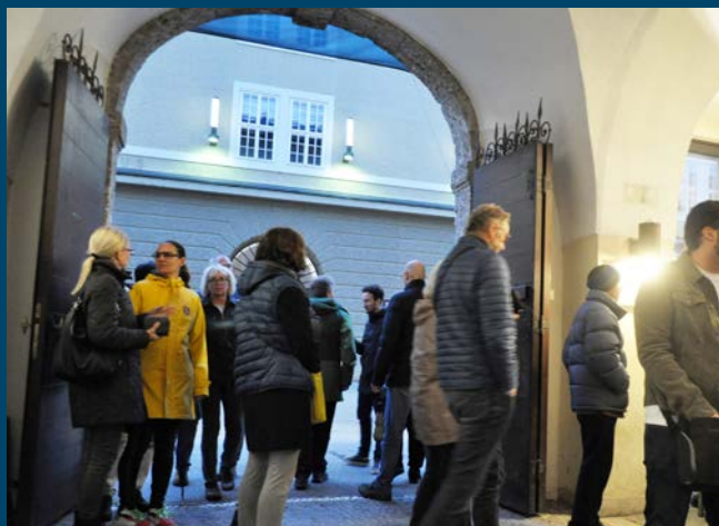
Großer Andrang am Eingangstor ...