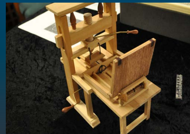
Und auch die Druckerpresse des Johannes Gutenberg war zu sehen - allerdings im stark verkleinerten Maßstab von ca. 1:10.