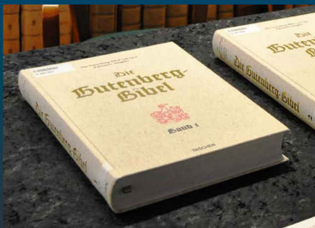
Unter den ersten Druckwerken: natürlich die berühmte Gutenberg-Bibel (in zwei Bänden), hier als Faksimile.