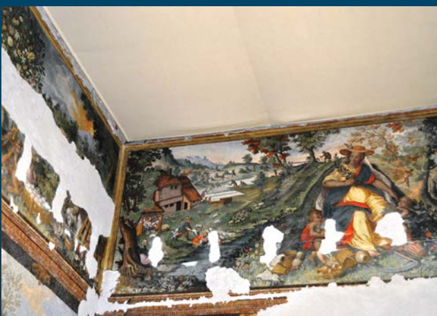
Beeindruckende Wandmalereien finden sich auch im Vierjahreszeitenzimmer.