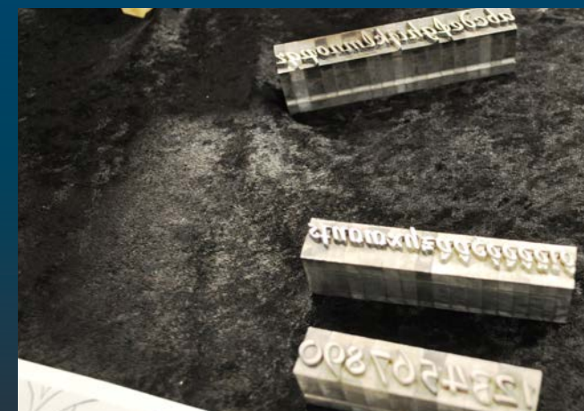
Drucklettern im Bleisatz. Wichtiger Bestandteil von Gutenbergs genialer Erfindung ...