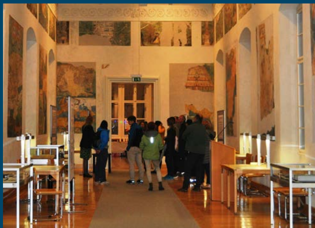
Schmuckstück Landkartengalerie im Toskanatrakt: Immer einen Blick wert.

Ausstellung in der Fakultätsbibliothek Rechtswissenschaften: Frau im Recht