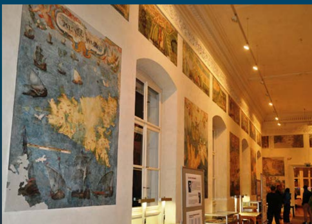
Jahrhundertlang waren die Landkarten aus dem 16. Jahrhundert durch Übermalungen verdeckt und vergessen. Erst bei der Renovierung ab 1986 kam diese kunsthistorische Sensation zum Vorschein.