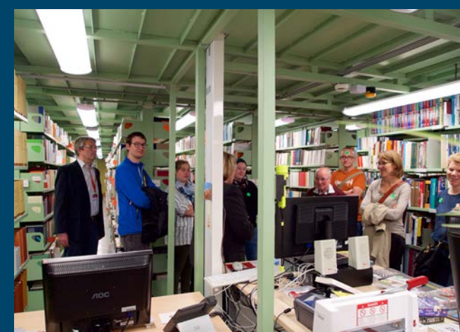
Sonst nicht mögliche Einblicke: Die Führungen in die unterirdischen Magazine waren gut besucht ...