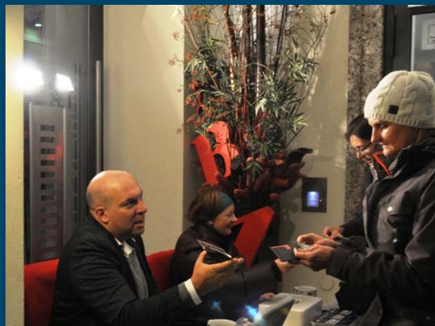
MitarbeiterInnen der Universitätsbibliothek Salzburg beim Ticketverkauf ...