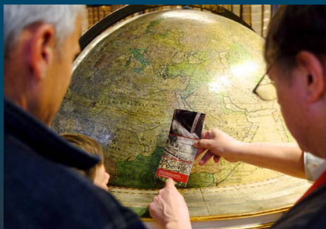
Gelegenheit, den berühmten Fürstaller-Globus in der Bibliotheksaula zu bestaunen ...