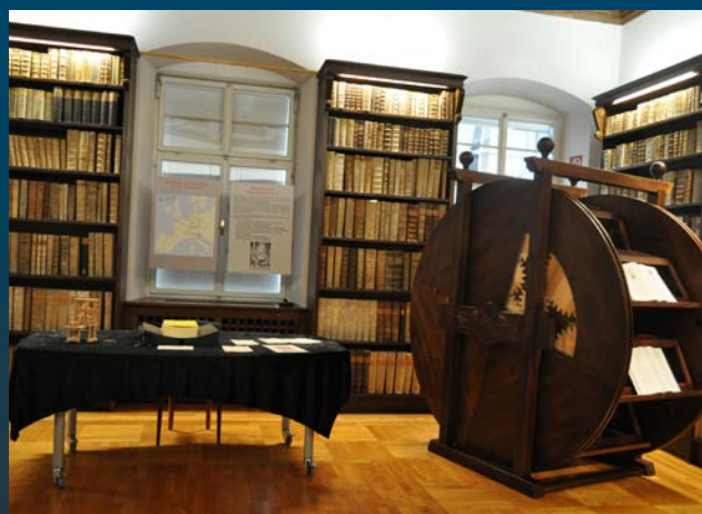
... und eine ganz neue Attraktion: den Nachbau des Bücherrades, einer Erfindung des italienischen Ingenieurs Agostono Ramelli aus dem 16. Jhdt.