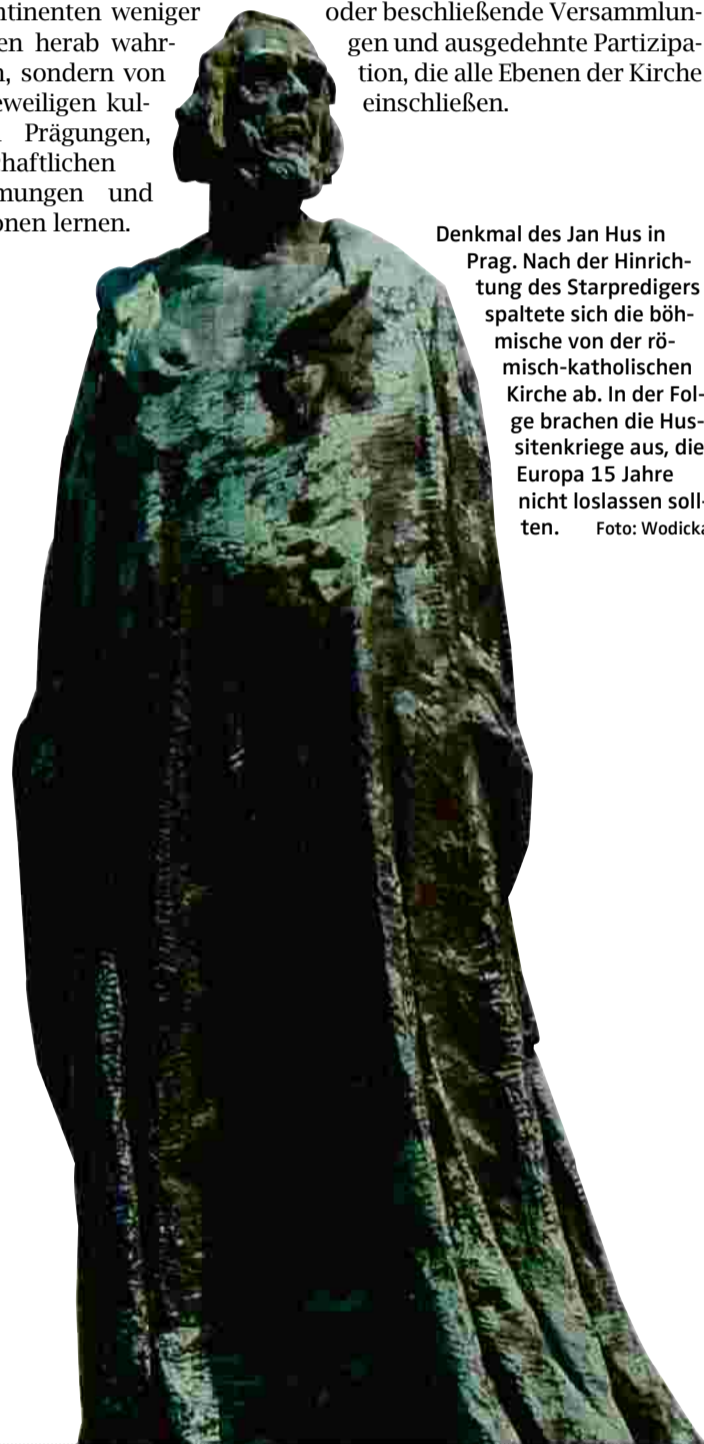
Denkmal des Jan Hus in Prag. Nach der Hinrichtung des Starpredigers spaltete sich die böhmische von der römisch-katholischen Kirche ab. In der Folge brachen die Hussitenkriege aus, die Europa 15 Jahre nicht loslassen sollten.

Eine Demokratisierung würde heißen: eine Stärkung des synodalen Prinzips, also effizient beratende oder beschließende Versammlungen und ausgedehnte Partizipation, die alle Ebenen der Kirche einschließen.