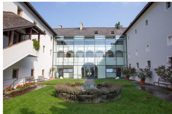
Foto: Am Standort in Hallein/Rif ist der FB Sport- und Bewegungswissenschaft situiert. | © Matthias Freynschlag