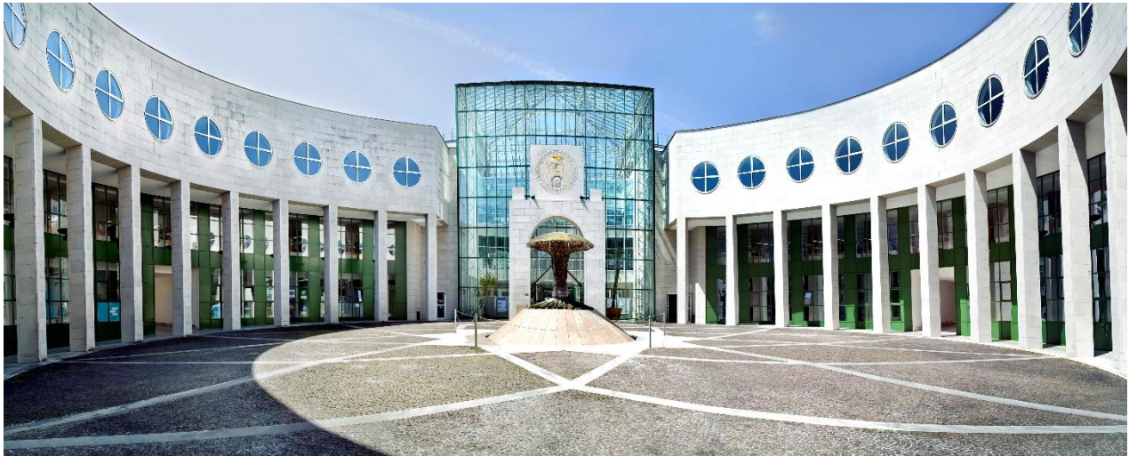
Foto: Große Teile der NLW Fakultät befinden sich am Standort Freisaal. | © Luigi Caputo