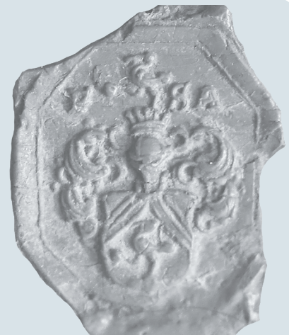
Siegelrest aus der ehemaligen Silberkammer, Alte Residenz, Wappen unbekannt

Im Anschluss Umtrunk in der Abgusssammlung