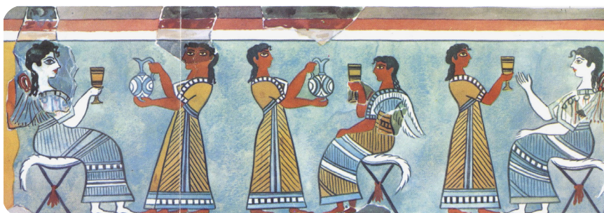
Ausschnitt Camp Stool Fresco, Knossos (N. Platon, KretChron 13, 1959, Taf. 33)

Aus der neupalastzeitlichen Hafensiedlung von Kato Zakros in Ostkreta – in der Phase Spätminoisch I ein Knotenpunkt für den Überseehandel Kretas mit dem Osten und Süden – sind mehr als 550 Tonplomben bekannt. Diese Tonplomben, die mit einer Vielzahl unterschiedlicher Siegel gestempelt wurden, dienten größtenteils der Sicherung von gefalteten, dünnen Lederstücken, welche wahrscheinlich als Träger für kurze Texte in Linear A-Schrift fungierten. In diesem Vortrag werden die Siegelabdrücke, die Tonplomben und die Versiegelungspraktiken zunächst voneinander getrennt und danach synthetisch betrachtet, um erstens ein besseres Verständnis der Siegelpraxis in Kato Zakros zu gewinnen und zweitens möglicherweise bestimmte Individuen oder gesellschaftliche Gruppen zu identifizieren, die in dieser Verwaltung aktiv waren.