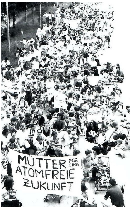
Die grenzüberschreitende Demonstration am 22. Juni 1986 gegen die geplante Atommüll-Aufbereitungsanlage in Wackersdorf/Bayern.

Stimme aus Irland: Liam O'Maonlai , Gründer der Rockband „Hothouse Flowers“, ist ebenso ein Komponist und Solosänger traditioneller, gälischer Weisen. Er gehörte zum „WUH-Board of Listeners“.