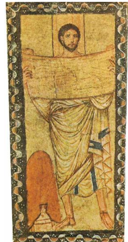
Esra / Moses (?) liest aus der Tora, Wandmalerei aus Dura-Europos, Mitte 3. Jh. u. Z.