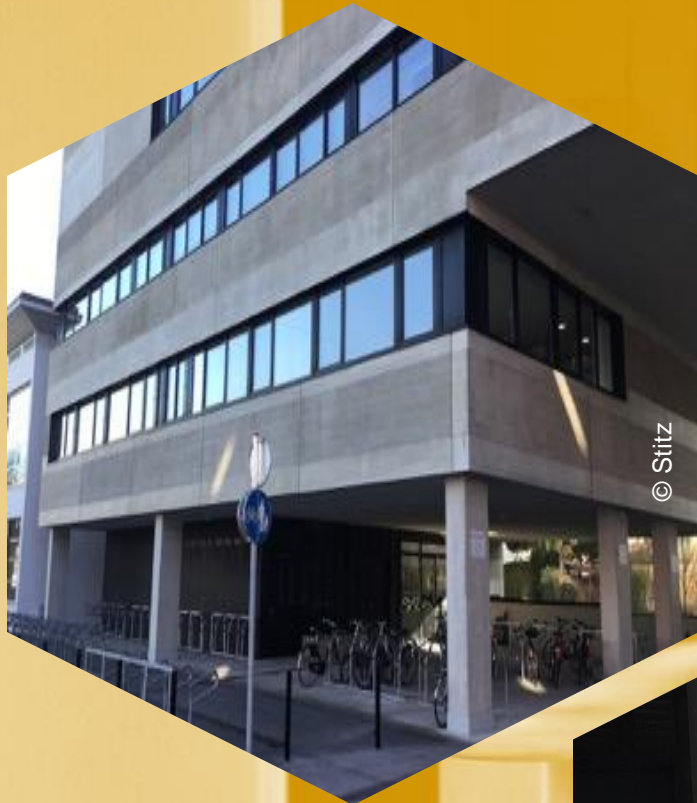
Eingang zum Gebäude