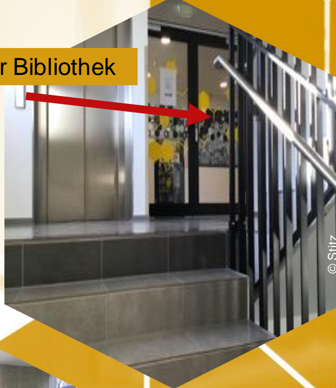
Eingang zur Bibliothek