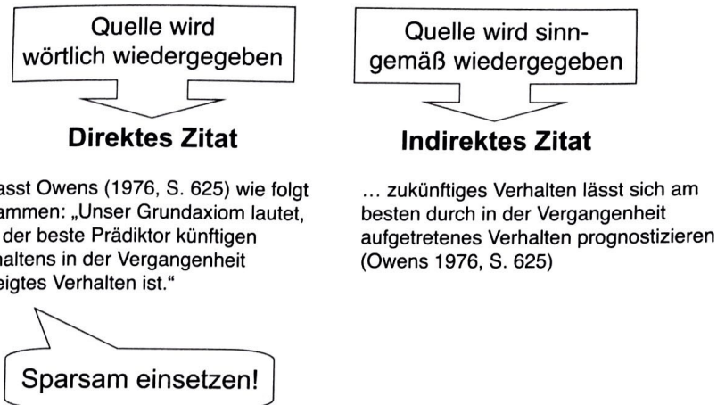
Abb. 8-2: Direkte und indirekte Zitate

Wie Sie aus dem folgenden Beispiel ersehen können, wird im Text im Anschluss an die sinngemäß wiedergegebene Textpassage ein Fußnotenzeichen gesetzt. In der Fußnote wird zunächst das Fußnotenzeichen wiederholt. Um kenntlich zu machen, dass es sich um ein indirektes Zitat handelt, folgt danach die Abkürzung „Vgl.“ (für „Vergleiche“). Es folgen der Nachname des Autors, das in Klammern gesetzte Erscheinungsjahr des Werkes sowie die Zitatstelle, also jene Seite(n), von welcher/-n das Zitat stammt: