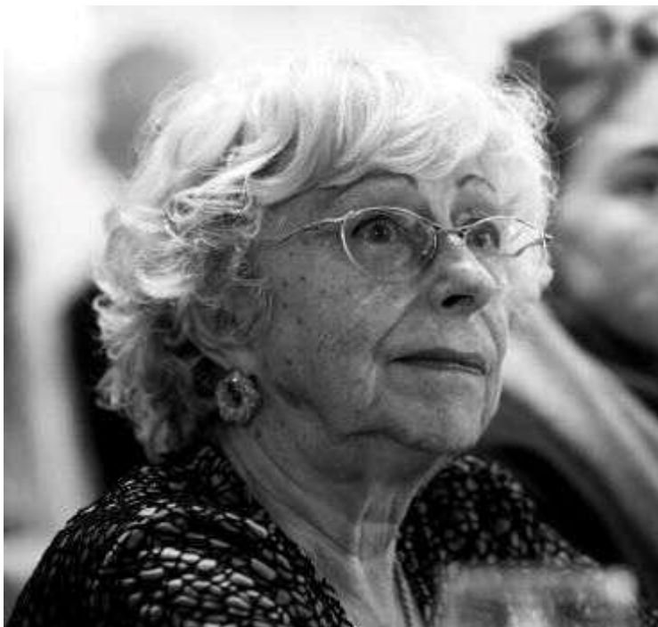
Christine Haidegger bei den Rauriser Literaturtagen 2016

Im Zuge des im Frühjahr 2024 stattgefundenen Ankaufs des Nachlasses von Christine Haidegger (1942–2021), die neben ihrer literarischen Tätigkeit auch als Organisatorin und Funktionärin große Verdienste erwarb, kam eine umfangreiche Dokumentation der von ihr zwischen 1975 und 1980 herausgegebenen Zeitschrift projekt IL ins Literaturarchiv. Der Titel war als Akronym für „Projekt Ihre Literatur“ zu verstehen und bezog sich auf die Aktivitäten einer Salzburger Autor*innengruppe, die wöchentlich zusammenkam, um sich die eigenen Texte vorzulesen und darüber zu diskutieren; einmal im Monat veranstaltete man auch gemeinschaftlich Lesungen, die im Traklhaus stattfanden.